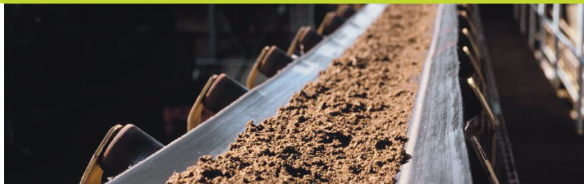
Tapis d'évacuation des écumes dans l'usine.