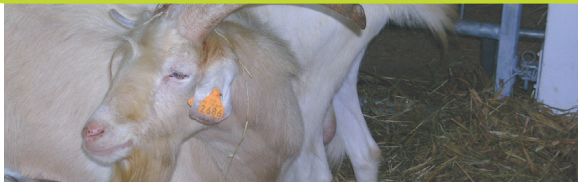
Caprins à viande croisés Boer.