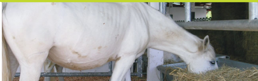
Cheval comarquois de club hippique.