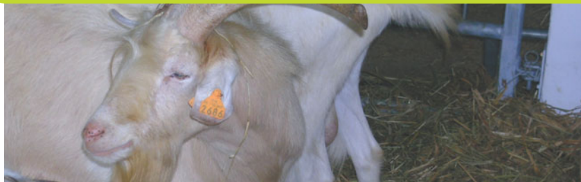
Caprins à viande croisés Boer.