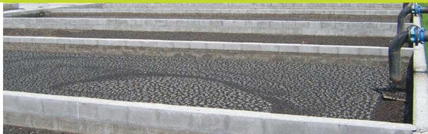
Lit de séchage des boues de station d'épuration (Saint-Leu).